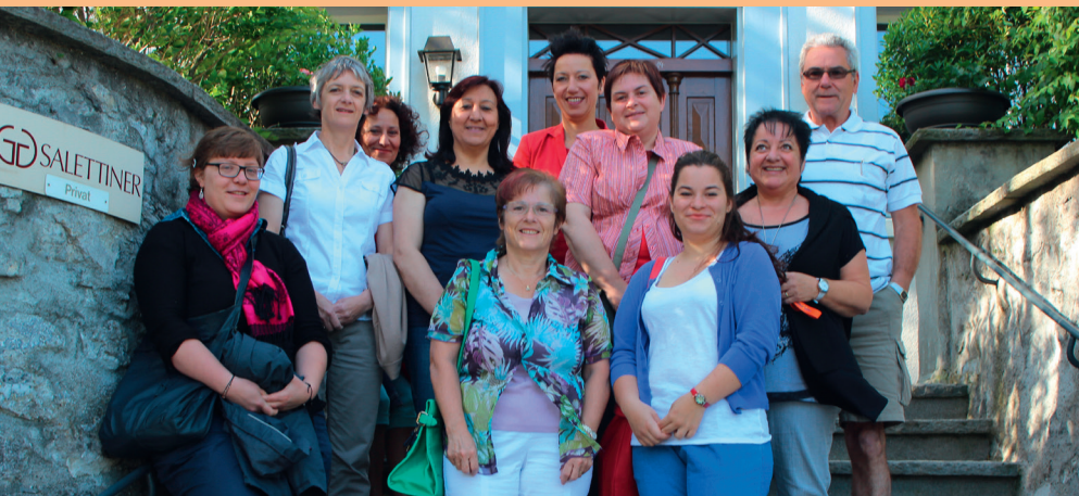
Das engagierte Team vom Haus Gutenberg vor der Abfahrt zum jährlichen Ausflug.