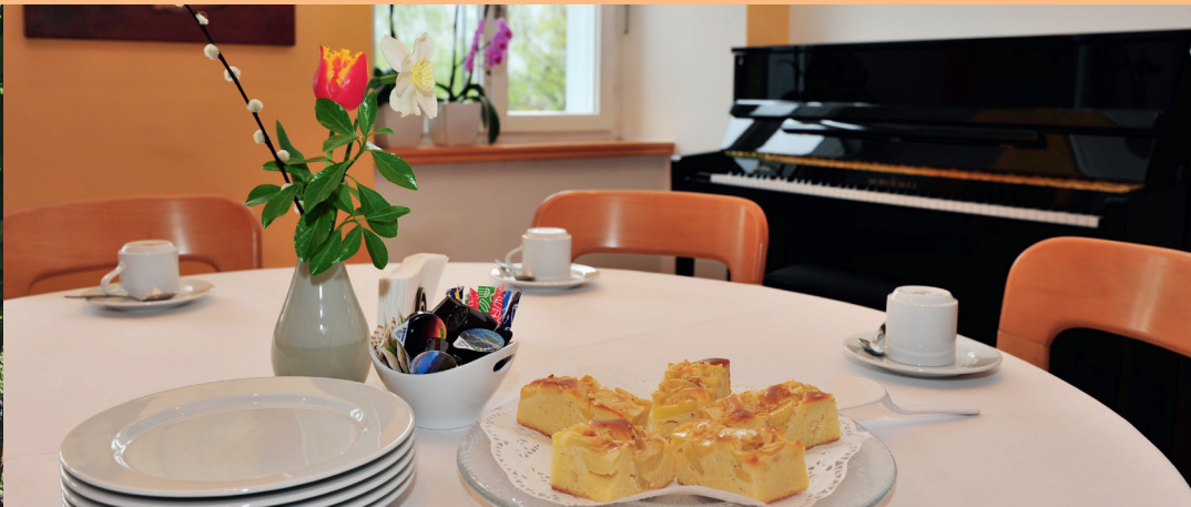
Genuss und Harmonie perfekt verbunden.