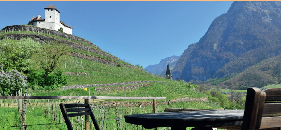
Besucherinnen und Besucher schätzen die schöne Lage des Hauses.