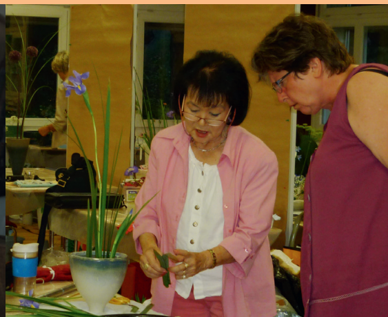
Gut im Bild sein: Dreimal im Jahr erscheint das Kursprogramm.