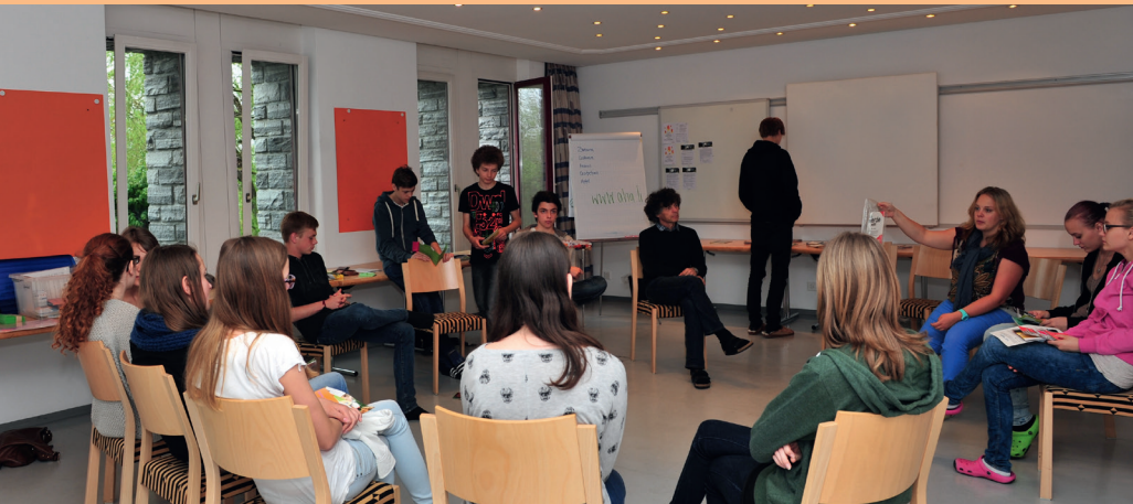
Die Schulentage nehmen einen festen Platz ein.