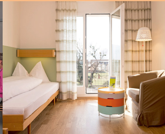
Die Gästezimmer wurden aufgefrischt.