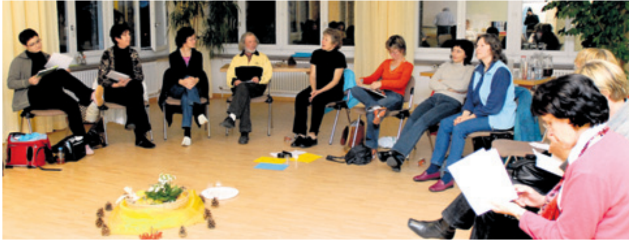
Auf der Suche nach dem Glück: Ein Tagesseminar im Haus Gutenberg in Balzers.