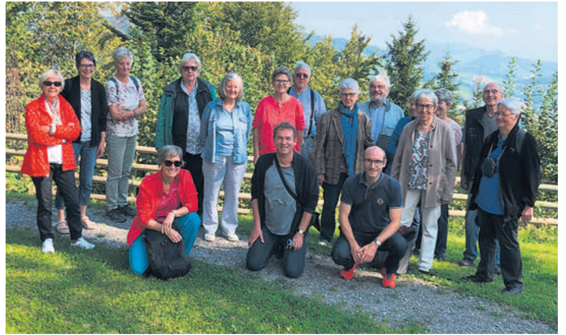
Die Teilnehmenden der Pilgerfahrt nach Hergiswald im Kanton Luzern.