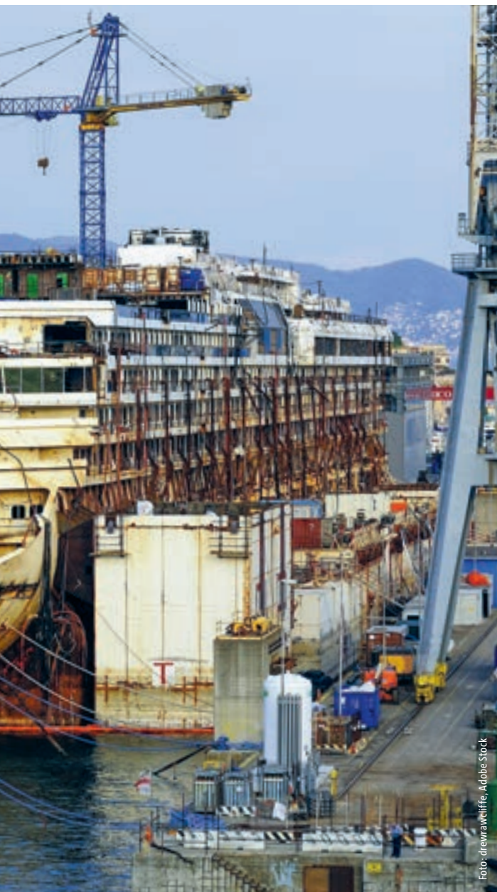
ITALIENS TITANIC: Zehn Jahre nach dem Unglück der Costa Concordia