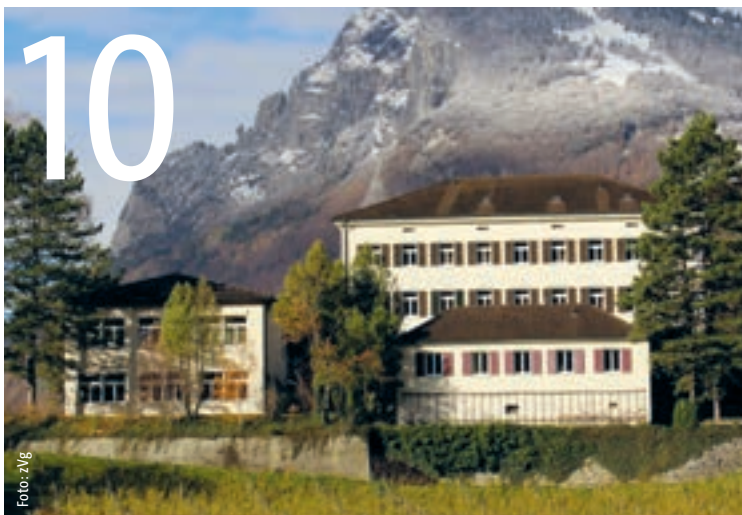
MEHR WISSEN, BESSER LEBEN: Das Bildungshaus Gutenberg in Balzers